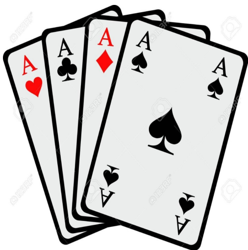
Jeux de cartes