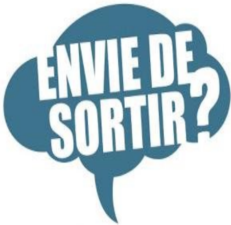
Sorties culturelles et découvertes