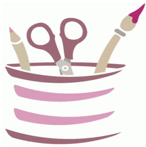
Loisirs créatifs enfants