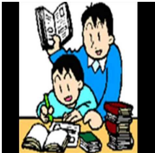
Aide scolaire primaire